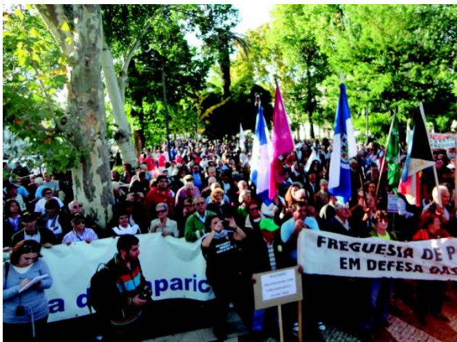
Manifestação em defesa das Freguesias e do Poder Local Democrático em Setúbal. A Freguesia da Baixa da Banheira fez parte da organização.